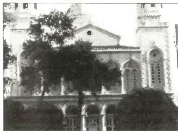
Η εκκλησία της Αγίας Νάπας στη Λεμεσό.